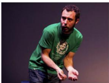
Mi primera vez (2011) Sala Muntaner