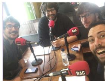
Colaboraciones radio (2016) Emisora RAC1