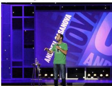
Grabaciones TV (2015) Comedy Central CC