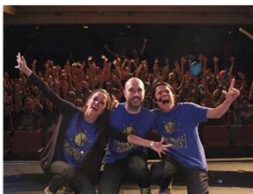
Improcedentes (2014) Teatro del Raval