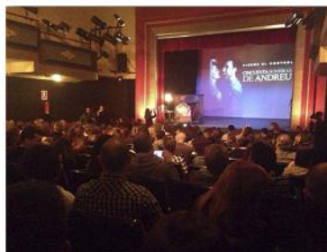
50 Sombras de Andreu (2014) Teatro del Raval