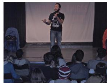
Vermunólogos (2014) Teatro Llantiol